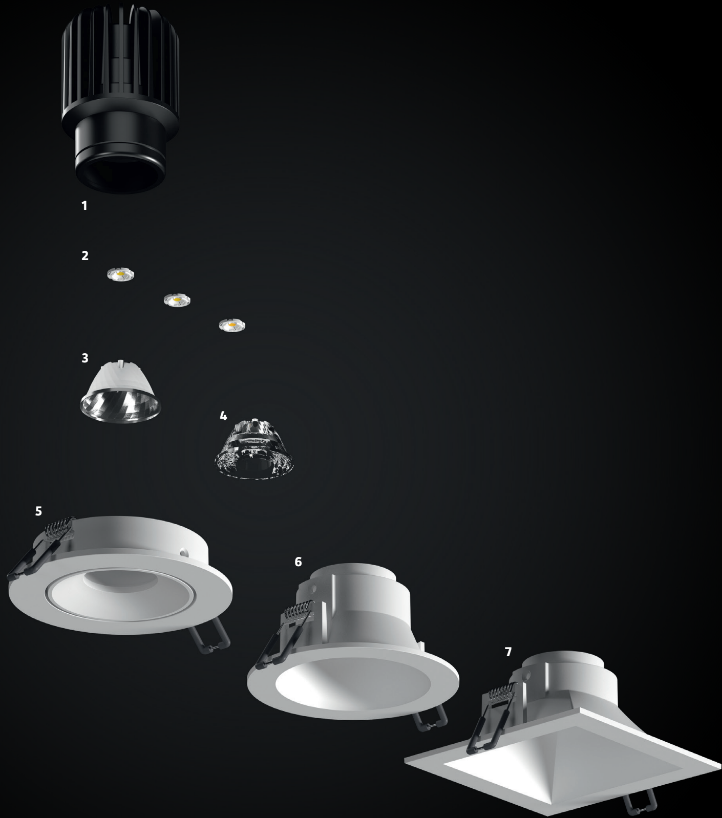
1 KÜHLKÖRPER 2 LED-PLATINE 4000 K, 3000 K, 2700 K 3 REFLEKTOR 4 LINSE 5 INNENRING BÜNDIG ABSCHLIESSEND, RUND 6 INNENRING ZURÜCKVERSETZT, RUND 7 INNENRING ZURÜCKVERSETZT, QUADRATISCH