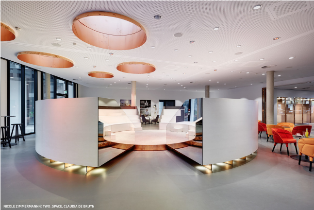
NICOLE ZIMMERMANN © TWO_SPACE, CLAUDIA DE BRUYN