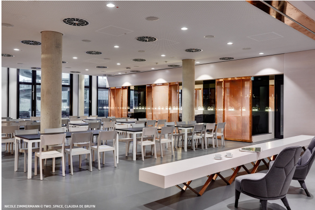
NICOLE ZIMMERMANN © TWO_SPACE, CLAUDIA DE BRUYN