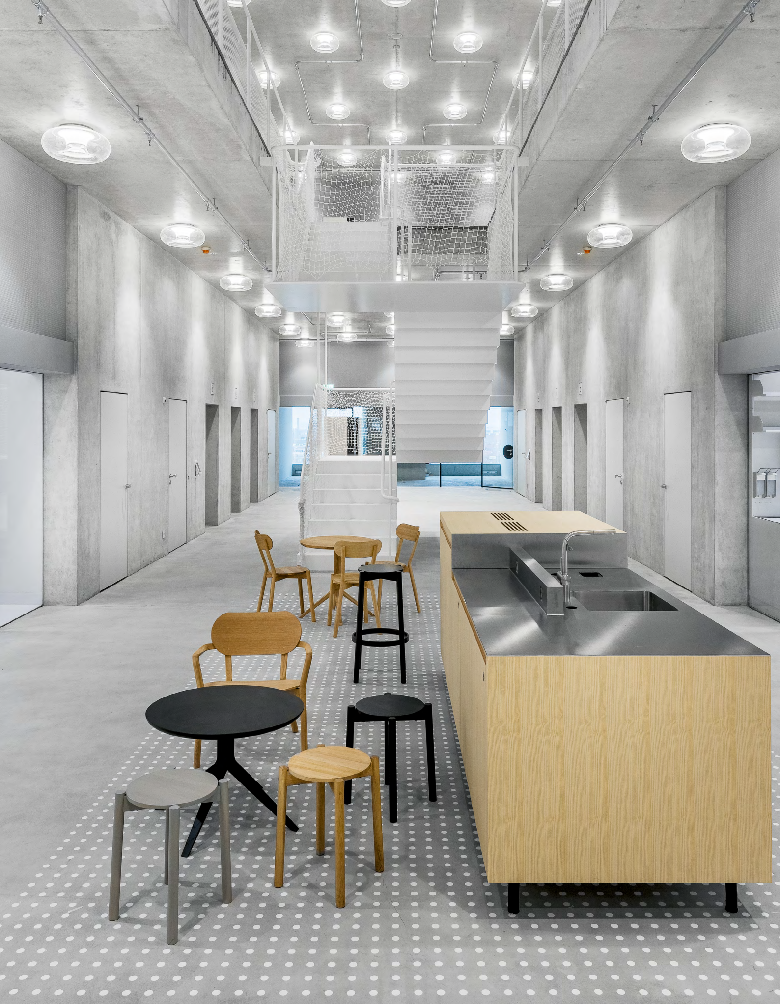
Biozentrum, Bâle, Suisse Luminaire utilisés: Torus Bespoke. Design: Ilg-Santer Architekten AG und Licht Kunst Licht AG.